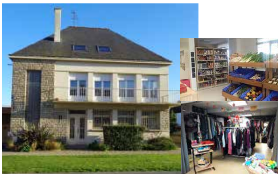
Maison des solidarités

Pour conclure, la commune a su s'appuyer sur un ensemble de partenaires pour fusionner les expertises, trouver les bons outils et les financements dans l'objectif de renouveler son attractivité. ■