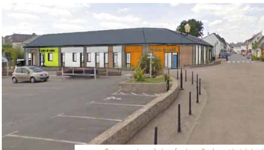
Futures maison pluri professionnelle de santé et épicerie

Il est le fruit d’un ensemble d’études, et de consultations conduites au cours des années précédentes. Le PADD, le projet de santé et bien d’autres documents nourrissent la réflexion, qui se traduit dans le projet municipal 2014-2020. En 2016, la commune fait appel au cabinet